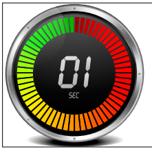
Sekundenschneller Wechsel zwischen Spalt- und Kontaktschweißen