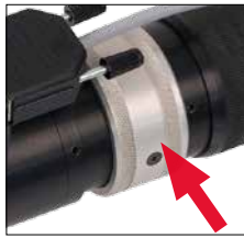
Instant switching between gap and contact welding