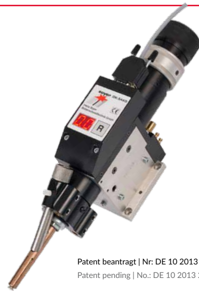
Patent beantragt | Nr: DE 10 2013 201 463 A1 Patent pending | No.: DE 10 2013 201 463 A1